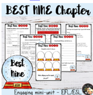
Séquence Mini Best Nine - 3e