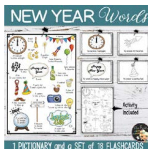
Flashcards New Year avec Pictiary