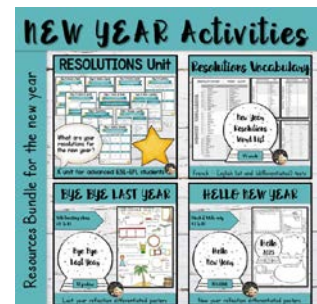
Séquence Resolutions - 3e Bundle