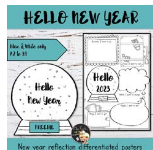
Activité - Hello New Year

Nous vous souhaitons une belle semaine et vous disons à dimanche prochain pour une nouvelle séquence détaillée !