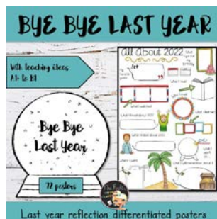
Activité - Bye Bye Last Year